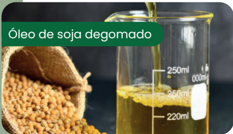
Óleo de soja degomado