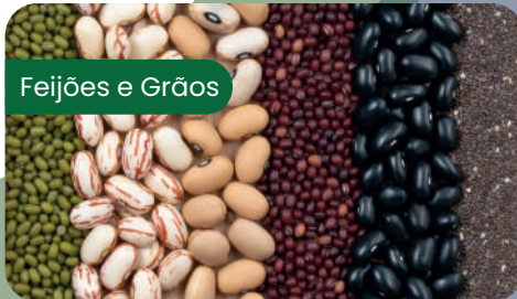
Feijões e Grãos