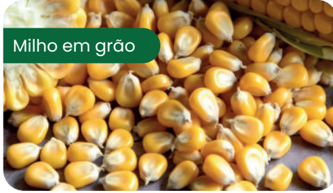
Milho em grão