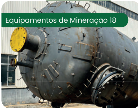
Equipamentos de Mineração 18