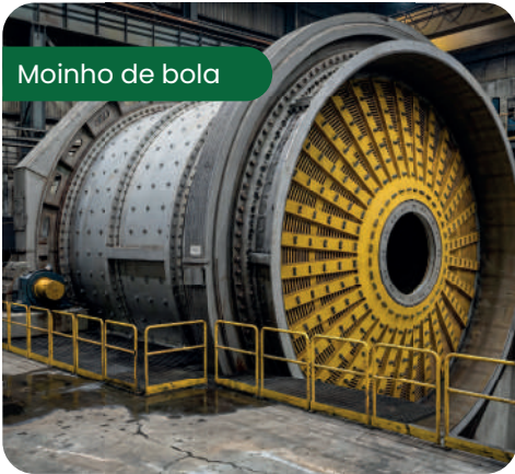
Moinho de bola