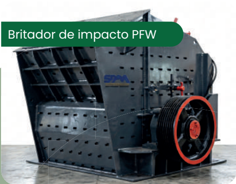
Britador de impacto PFW