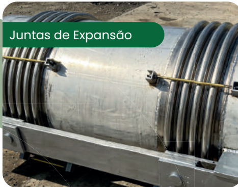
Juntas de Expansão