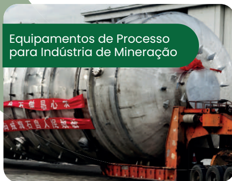
Equipamentos de Processo para Indústria de Mineração